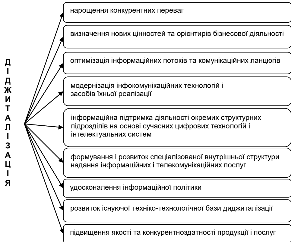
Рис.2. Завдання діджиталізації підприємницької діяльності