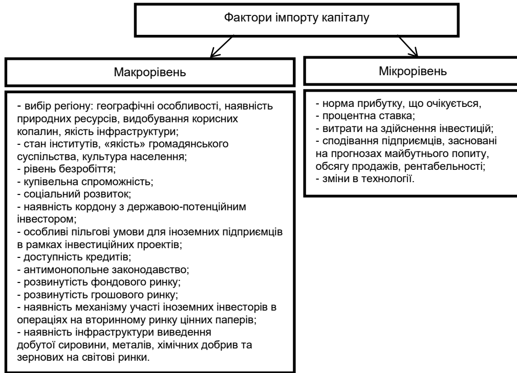
Рис.1. Розподіл факторів інвестиційного попиту на макро- і мікрорівень державного регулювання