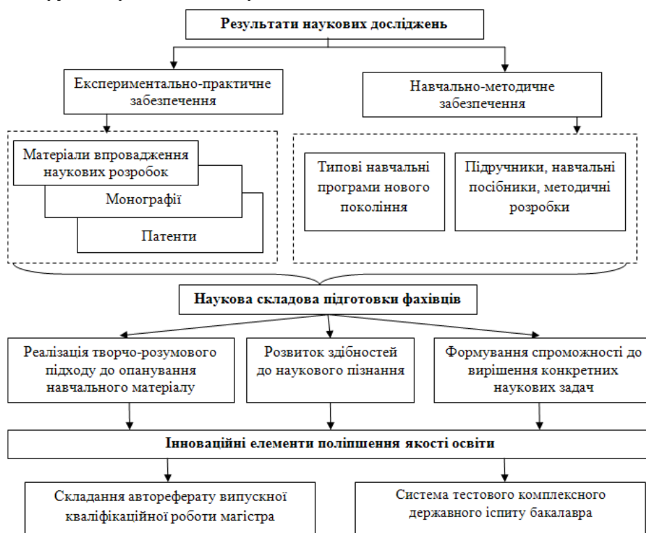
Рис. 2 – Управління екологічною безпекою на основі соціогенних чинників – реалізація наукової складової підготовки фахівців

Як уже зазначалося, екологічну небезпеку формують соціогенні чинники, що пов'язані з недостатнім рівнем екологічної освіти (підвид небезпеки, що визначається інформаційно-освітніми чинниками). Як елемент управління екологічною безпекою нами запропоновано схему використання результатів наукових досліджень у навчальному процесі підготовки висококваліфікованих фахівців (рис. 2), яку впроваджено у конкретному навчальному закладі (КрНУ).