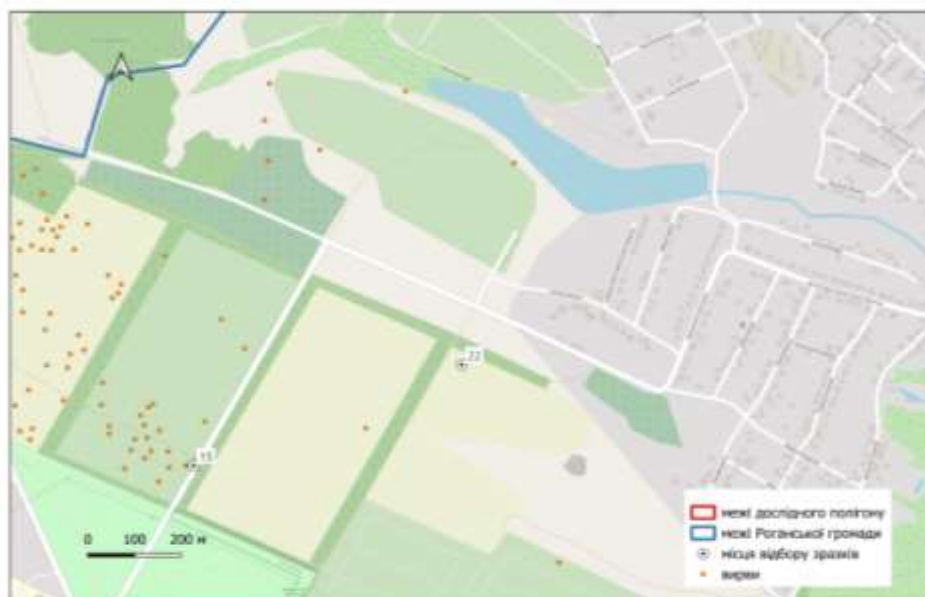
Рис. 3 - Місце відбору фонові проби (т.№ 22)

Для порівняльного аналізу у вересні 2025 року було відібрано фонову пробу (точка № 22) на ділянці, де не зафіксовано наслідків бойових дій (рис. 3). Дана точка розташована на значній відстані від потенційних джерел забруднення важкими металами, зокрема від Кільцевої дороги, яка є джерелом постійного техногенного впливу через інтенсивний рух автотранспорту. Це програмне забезпечення з відкритим вихідним ко-