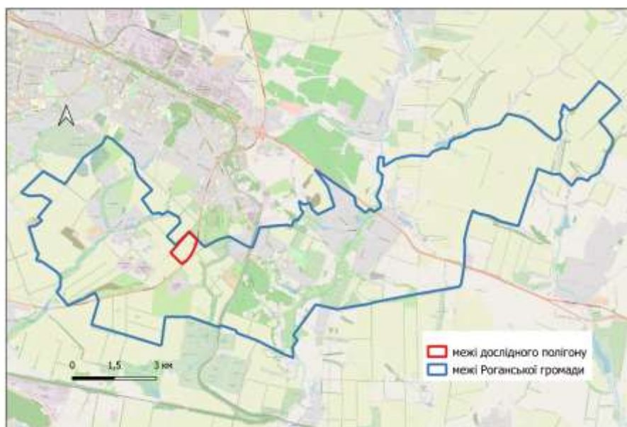
Рис.1 – Місце розташування дослідного полігону

Ключовим завданням робіт визначено вивчення мілітарного забруднення ґрунтів важкими металами. При виборі місць відбору проб враховувалася інтенсивність бойових дій, що тривали на даній території у 2022 році [16]. Показником антропогенного впливу на дослідному полігоні слугувала щільність виврв, що утворилися внаслідок влучань боєприпасів (рис. 2) [23].