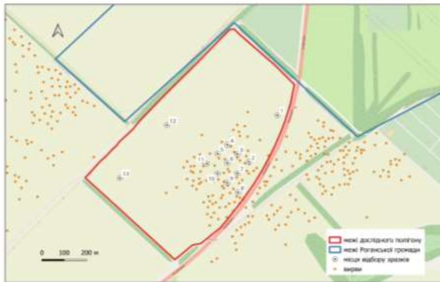
Рис.2 – Місце розташування дослідного полігону