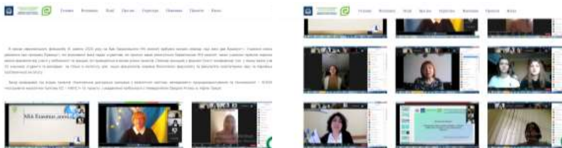
Рис. 2 – Онлайн семінар «Що мені дав ЕРАЗМУС+», 16 жовтня 2020 р.

( http://ecology.karazin.ua/news/onlajn-seminar/ )