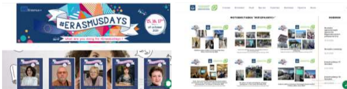
Рис. 1 – Фотовиставка «Мій Еразмус+», 15-17 жовтня 2020 р. ( http://ecology.karazin.ua/erasmusdays-2020/ )