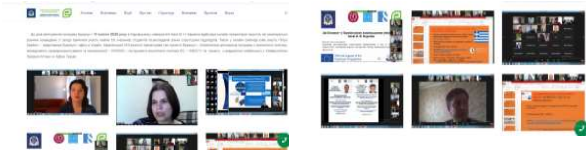
Рис. 3 – Онлайн презентація проектів в Каразінському університеті, 17 жовтня 2020 р. ( http://ecology.karazin.ua/news/onlajn-prezentacija-proektiv-karazinskogo-universitetu/ )