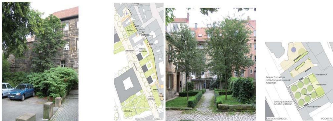
Рис. 4 – Приклади використання так званих кишенькових парків з варіантами садівництва в місті Байройт [12]

Управління проектами за 2011 рік – 60 000 тис. євро в рік