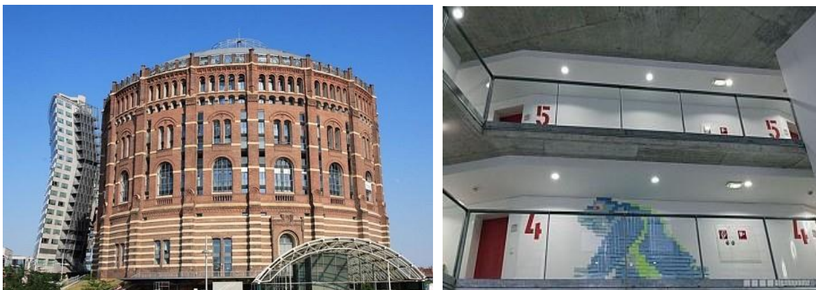
Рис. 2 – Вигляд споруди «В» з зовні (а) та з середини (б) [11]

В споруді колишнього газгольдера «С» було розміщено три-поверховий торговельно-офісний центр, а вище 6-ти поверховий житловий комплекс з 92 квартирами. На період виконання будівельних робіт це був найбільший будівельний майданчик Європи, з площею майже 220,0 тис. м 2 [11]. Після розробки проектної документації та проведення комплексу підготовчих робіт, приступили до демонтажу металевих конструкцій газгольдерів.