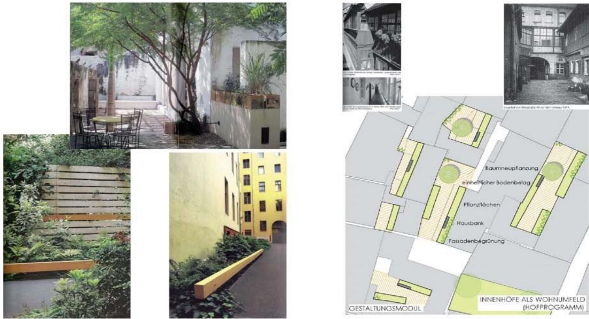
Рис. 5 – Майбутній проект створення гастрономічних зон з озелененням фасадів будинків [12]

У всіх трьох областях перепланування міста Байройт, і на всій території міського оновлення реабілітація та модернізація населення, а також активізація громадян та мешканців є центром оновлення міст. Подальші заходи з реорганізації є необхідними та запланованими. Також у центрі міста Байройт немає великих коричневих полів, які потребують активізації. Тому не потрібно використовувати комплексний пакет правових інструментів у всеосяжній процедурі, і рекомендується проводити санацію