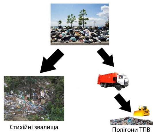
Рис. 3 – Існуюча система поводження з ТПВ в смт. Бабаї та с. Затишне

Таким чином, схема збирання та поводження з відходами в селищах має змінено найбільш ефективним, раціональним та прийнятним чином (рис.2).