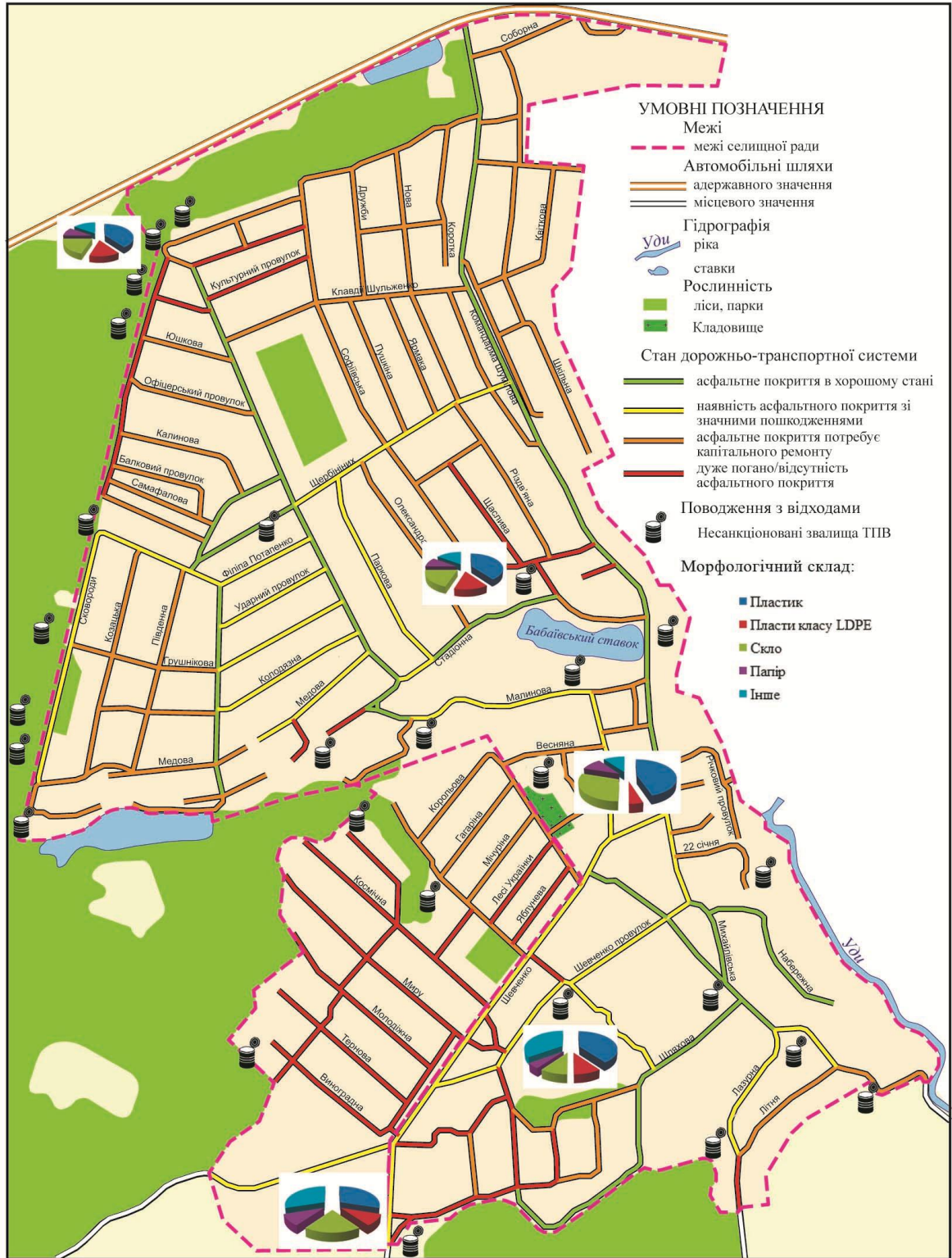
Рис. 1 – Несанкціоновані звалища смт Бабаї та с. Затишне

диться на відстані 10 м від вул. Сковороди. Об'єкт має витягнуту форму, розташований вздовж ґрунтової дороги, що проходить лісом. Звалище складається з комплексу точкових об'єктів. Стан дорожнього покриття вул. Сковороди оцінюється в три ба-