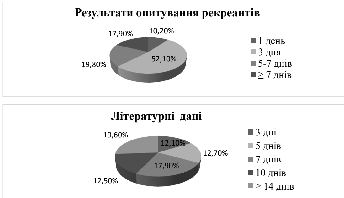
Рис. 1 – Частота виїздів на відпочинок неорганізованих рекреантів в літній період

– високі естетичні властивості ландшафту – 75,7 %; – ступінь збереження природних ландшафтів – 54,6 %; – висока якість пляжної зони (піщаний пляж, дно на мілководді, незамуленого) – 73,9 %; – наявність лісових масивів для здійснення прогулянок, збору ягід та грибів – 17,7 %; – можливість риболовлі – 12,4 %; – гарний екологічний стан – 68,3 %;