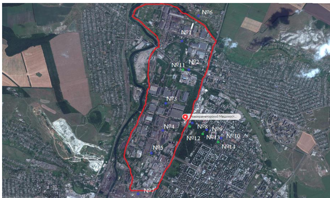
Червоний – точка відбору води; зелений – точка відбору рослинності (№№11-14); синій – точка відбору ґрунту (№ 1-10)

У 2017 року проведено ряд власних польових та лабораторних досліджень: відібрані проби води з водного об'єкту, проби рослинності та проби ґрунту. Точки відбору проб відображено на рис. 2.