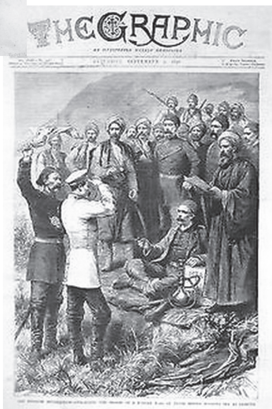
Рис. 2. Рисунок французского графика и иллюстратора Годфруа Дюран в британском еженедельнике “The Graphic”