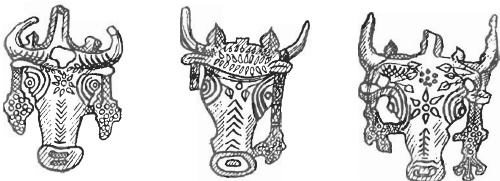
Рис. 2 Свищовые букрании (Ольвия) - IV - II вв. до н. э.

Возлияния и воскурения часто соединялись с другими обрядами, в частности с принесением в жертву животных. Сведения о проведении кровавых жертвоприношений в Северном Причерноморье содержат сакральные законы Ольвии III в. до н. э. и Фанагории II в. н. э. Об этом свидетельствуют костные остатки жертвенных животных [19, с. 145], а также букрании — стилизованные изображения головы жертвы. Предназначенное для жертвоприношения животное обычно украшали повязками и венками [1, с. 88]. Свищовые букрании IV — II вв. до н. э. в виде головы быка, украшенные повязками, розетками, листьями плюща, гроздьями винограда (рис. 2) [25, с. 84-106] и их изображения на монетах V — IV вв. до н. э. засвидетельствованы в Ольвии [26, с. 301-305]. На херсонесских алтарях IV — III вв. до н. э. встречаются изображения букраниев в виде голов козла, быка, барана [12, № 125; 27, с. 19].