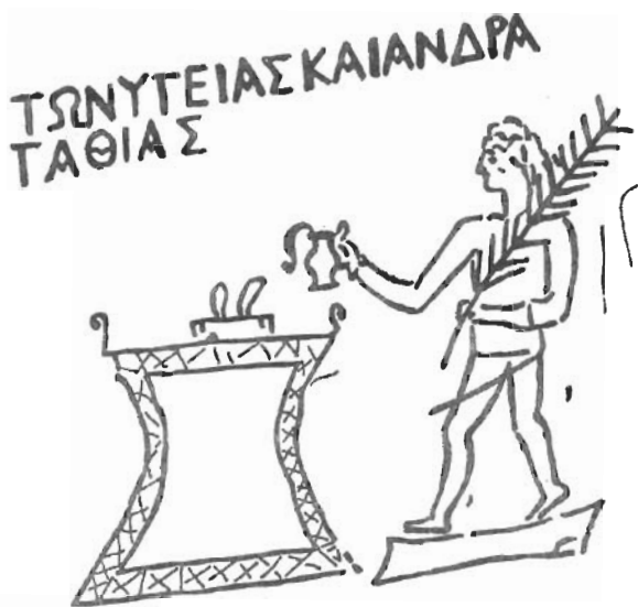
Рис. 1 Графическое изображение сцены возлияния со стелы первых веков н. э. (Ольвия)

Графическое изображение на ольвийской посвячительной стеле в честь Аполлона отражает обряд возлияния (рис. 1), по-видимому, совершавшийся в городах Северного Причерноморья [4, № 101]. Для проведения этого обряда существовали особые жертвенники с небольшими углублениями для жидкости [22, с. 71]. Вероятно, устраивались и воскурения, что подтверждают ритуальные курильницы, специально предназначенные для этих целей, из Ольвии [23, с. 109-116], Тапанса [24, с. 186-187] и некоторых других городов Боспора.