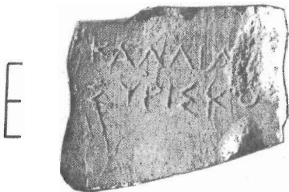
Рис. 3. Остракон

обнаружены черепки с процарапанными именами и патронимиками, которые получили интерпретацию как остраконы [4, с. 121-124]. Вновь найденное граффито принадлежит к тому же типу памятников. Хорошим шрифтом на черепке гераклейской амфоры параллельно верхней грани черепка процарапано имя «Каллиа[д], сын Сири-ска». Сочетание этих двух имен засвидетельствовано в Херсонесе впервые, хотя порознь они хорошо известны.