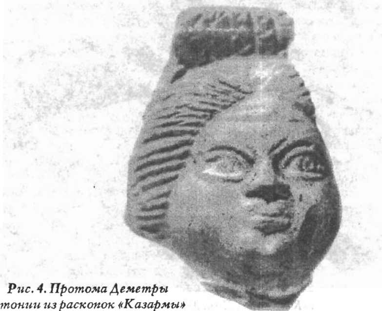
Рис. 4. Протома Деметры Хтонии из раскопок «Казармы»