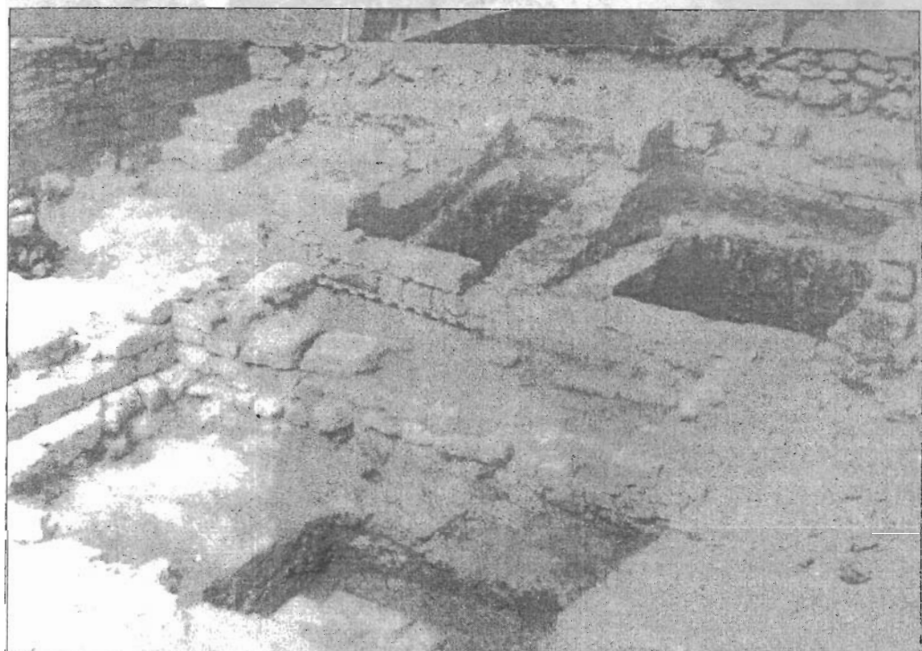
Рис. 2. «Казарма». Пом. 35, 36-К, 36-В