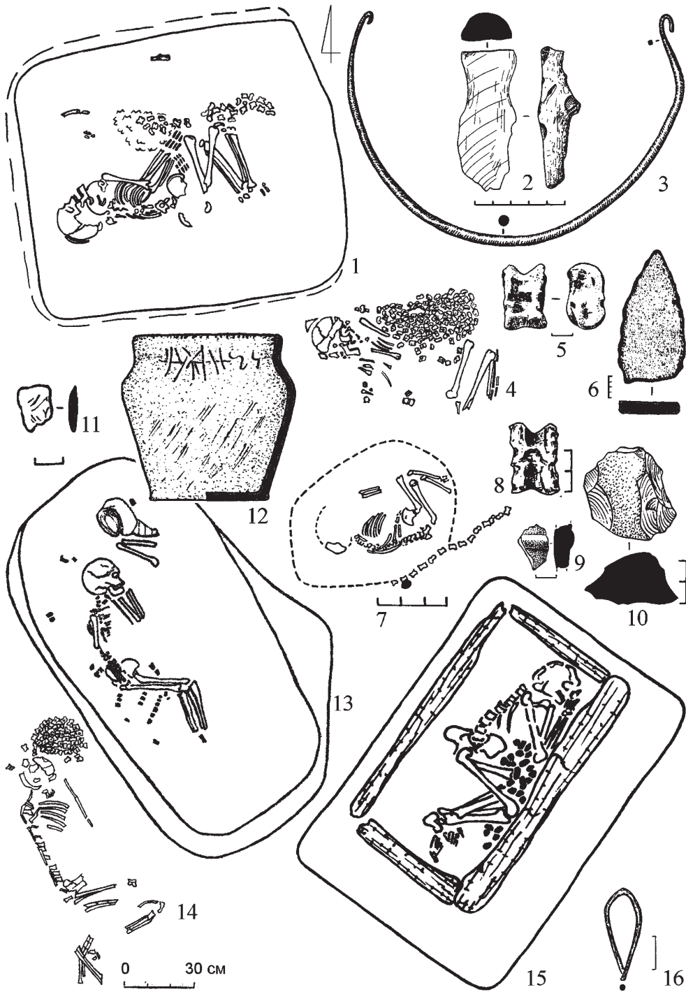
Рис. 1. Поховання з астрагалами Дніпро-Донської бабинської культури:

1-3 – Відродження II к. 2 п. 4; 4-6 – Макіївка к. 4 п. 1; 7-10 – Цимлянка I к. 3 п. 1; 11-13 – Мамай-гора п. 15; 14 – Шахтарськ к. 8 п. 3; 15-16 – Михайлики п. 13.