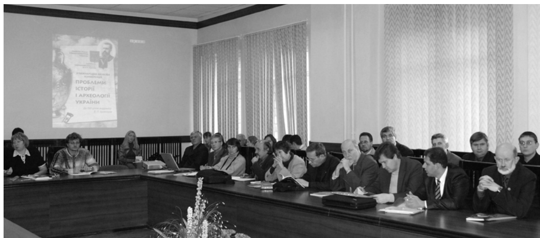
Пленарное заседание конференции

Западной Украины (Львов, Черновцы), а также небольших украинских городов (Алчевск, Дрогобыч, Нежин). Среди участников конференции весьма внушительным было представительство историков и археологов Российской Федерации: Белгород, Вологда, Воронеж, Москва, Ростов-на-Дону, Санкт-Петербург, Ставрополь, Ярославль. К началу работы научного форума были изданы материалы конференции [2].