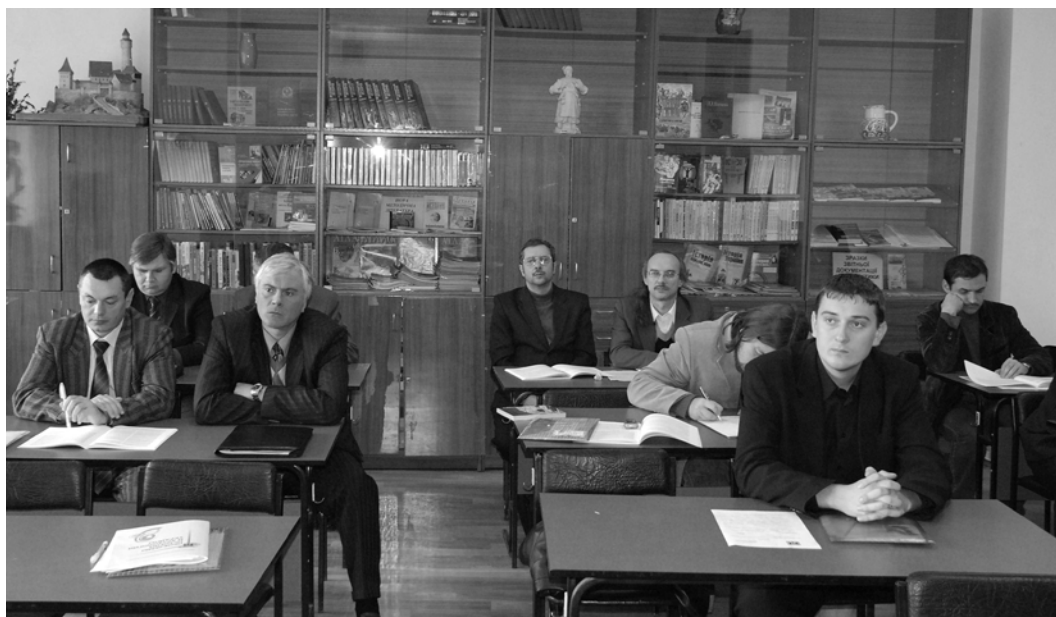
На заседании секции «История и культура античного мира»