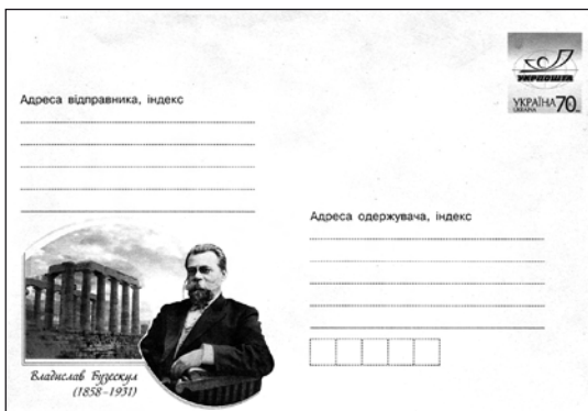
Юбилейный почтовый конверт, посвященный 150-летию со дня рождения академика В. П. Бузескула