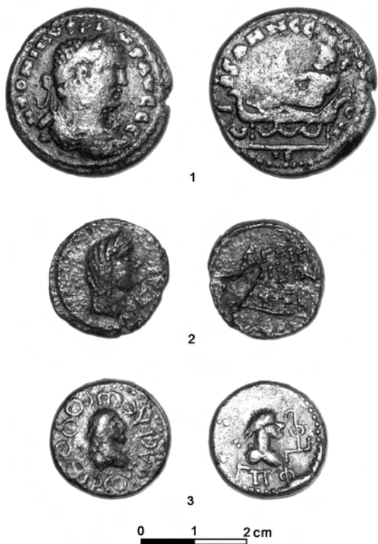
Рис. 1. Античные монеты из собрания Змиевского краеведческого музея:

Av.: Женская голова (Афродита Урания) в диадеме и покрывале, ободок из точек; Rv.: Нос корабля (прора) влево, над ним надпись в две строки АГРІІІ — ПΕΩΝ, справа знак номинала Η (8 унций); ободок из точек. Сохранность удовлетворительная, диаметр монеты 20 мм. Монетный тип определяется как редкий. А. Н. Зограф относит чеканку монеты к 17/16–14 гг. до н. э. [12, с. 193–195], К. В. Голенко к 14 г. до н. э. [13, с. 44–46], Н. А. Фролова к 18–12 гг. до н. э. [14, с. 5], В. А. Анохин датирует монету вторым правлением Аспурга (14/15–37/38 гг.) [15, с. 94, 95]. Монетный тип хорошо известен в литературе [12, табл. XLV, 14; 15, табл. 12 № 323; 16, табл. XXIII, I; 17, табл. I.14;]. Монета была обнаружена А. М. Комовым в 1986 г. у с. Тарановка (Змиевский район), хранится в Змиевском краеведческом музее, инв. № Осн. 932«А».