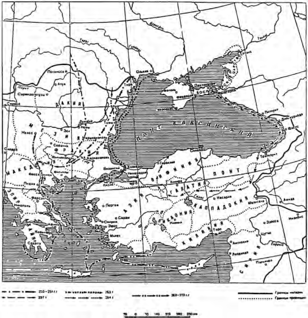
Рис. 2. Маршруты походов варварских отрядов в ходе Готских войн (по А.М. Ременникову [18, с. 147])