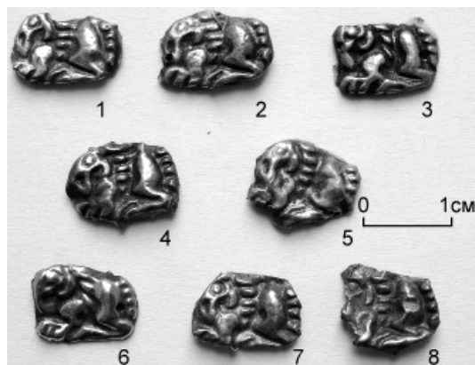
Рис. 3. Бляшки с изображением грифона из кургана № 25 Песочинского могильника (Харьковский исторический музей, ЛБЗ-404-408; 423-425)

Особенностям семантики хвоста хищников как условного знака-символа в зависимости от его расположения посвящено специальное исследование Ю. Б. Полидовича. Из выделенных автором иконографических вариантов наш