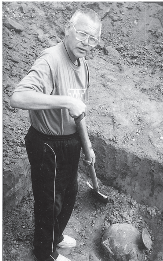
Исследование кургана скифского времени у с. Черемушная, 2002 год

Мы поздравляем нашего юбиляра и желаем здоровья и дальнейших творческих успехов.