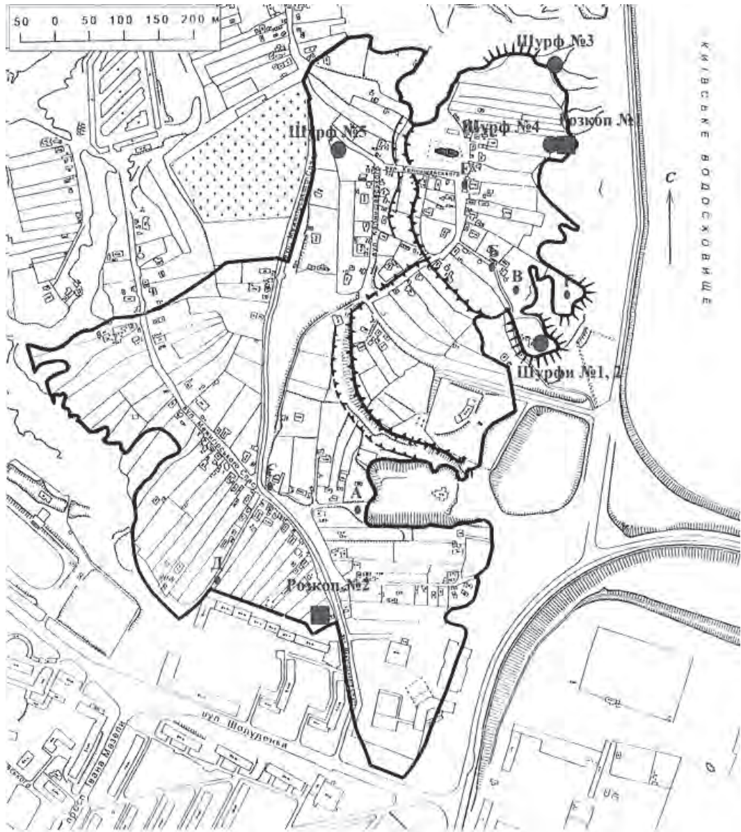
Рис. 1. Загальна схема археологічних робіт на території Вишгородського історико-культурного заповідника у 2012 р.