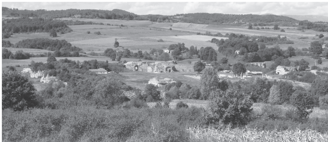
Abb. 1. Der spätrömische Kaiserpalast Romuliana bei dem Dorf Gamzigrad in Nordostserbien

Seit 1953 führen hier serbische Archäologen systematische Ausgrabungen durch. Freigelegt wurden bisher zwei Tempel, eine Thermenanlage, ein großer Repräsentationsbau sowie weitere Gebäude.