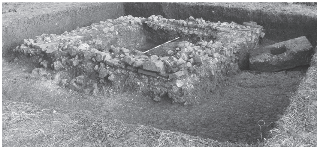
Abb. 4. Romuliana-Gamzigrad. Gemauerte Einfassung eines römischen Offiziersgrabes, 3. Viertel 3. Jahrhundert u. Z.