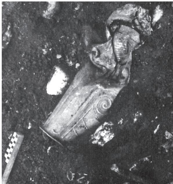
Фиг. 2а. Наколенникът(?) от Враца при откриването му [4, с. 59] Fig. 2a. The greave(?) from Vratsa as just discovered [4, с. 59]

ване да бъдат чифт 1 . Обстоятелството трябва задължително да се отчита, когато се правят опити за интерпретирането на четирите сребърни артефакта.