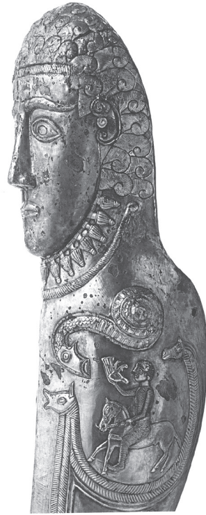
Фиг. 5а. Наколеникът(?) от Маломирово – Златиница, детайл [55, с. 67]

Fig. 5. The greave(?) from Malomirovo – Zlatinitsa [19, p. 181]