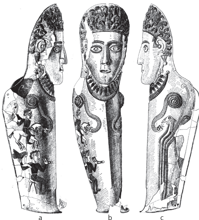
Фиг. 4. Наколенник(?) № 1 от Аджигьол [12, pl. 113]