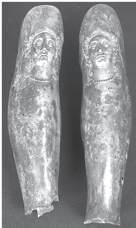
Фиг. 8. Наколеник от Олимпия [45, табл. 62, № 1] Fig. 8. A greave from Olympia [45, табл. 62, № 1]

практиката да се воюва само с един наколенник, както става ясно от находките в гроб 12 при Денда 1 . Но при разглежданите сребърни паметници обяснението, че и четирите са откривани по един 2 , а не на чифтове, защото били част от парадното въоръжение 3 не е убедително 4 . И ако археологическият контекст както в Аджигьол, така и във Враца е проблемен и оставя възможност за известна несигурност [4,