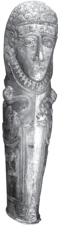
Фиг. 5. Наколеникът(?) от Маломирово – Златиница [19, р. 181]

Fig. 5. The greave(?) from Malomirovo – Zlatinitsa [19, p. 181]