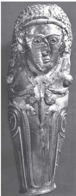
Фиг. 2. Наколенникът(?) от Враца [54, с. 248] Fig. 2. The greave(?) from Vratsa [54, с. 248]