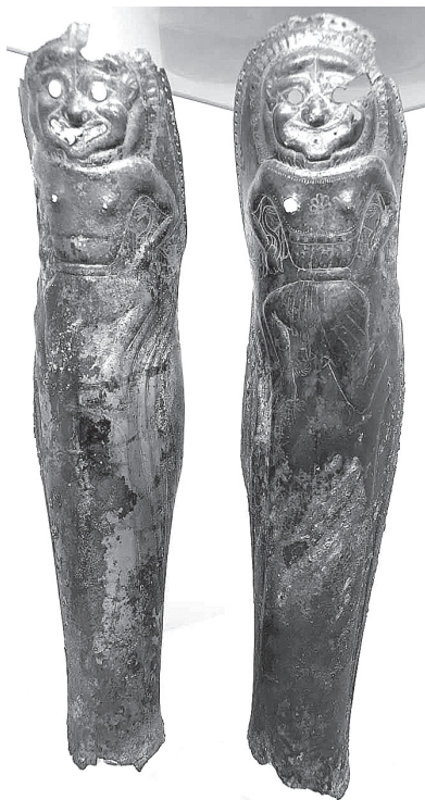
Фиг. 7. Наколенниците от Голямата Косматка Fig. 7. The greaves from Golyamata Kosmatka