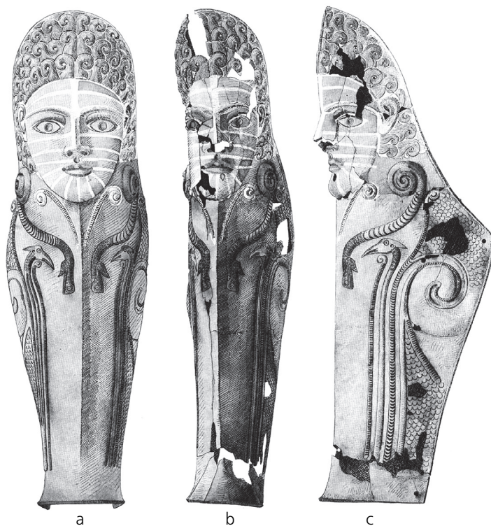
Фиг. 3. Наколеник(?) № 2 от Аджигьол [12, pl. 112]