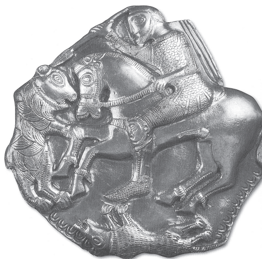
Фиг. 6. Апликацията от Летница [3, фиг. 15]