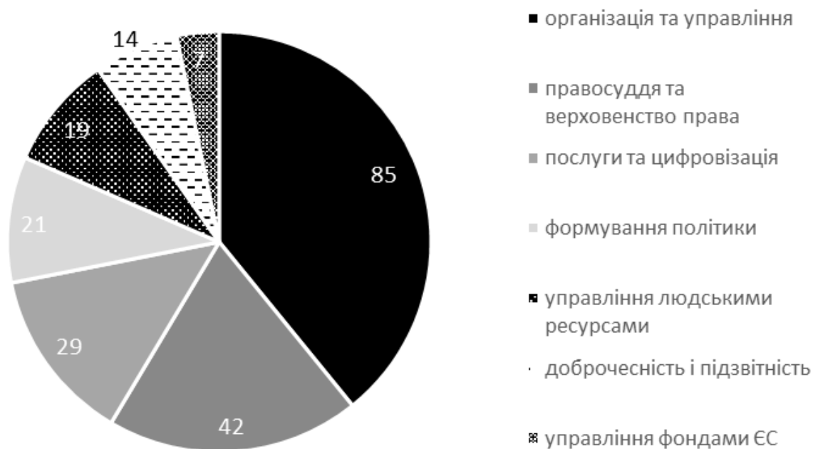
Рисунок 3. – Структура проектів TSI в 2022 р. за сферами політики [15]. Figure 3. – Structure of TSI projects in 2022 by policy area [15].

планування, інклюзивне та прозоре формування політики; відкрите та прозоре державне управління; доступну та орієнтовану на людину систему надання послуг; стале, ефективне та прозоре управління державними фінансами.