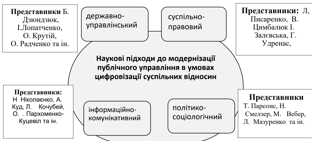
Рисунок 1. – Наукові підходи до модернізації публічного управління в умовах цифровізації суспільних відносин.

урбанізація, ефективність, індустріалізація, комп'ютеризація тощо». (Т. Парсонс, Н. Смелзер, М. Вебер, Л. Мазуренко та ін) [8; 15]. З позицій інформаційно-комунікативного підходу досліджується механізми цифрової трансформації крізь призму інформаційної безпеки, протидії пропаганді (Л. Кочубей, А. Куд, Н. Ніколаєнко, О. Пархоменко-Куцевіл та ін.) [4; 5; 9; 10].