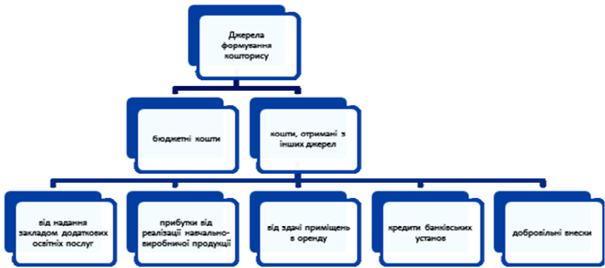
Рис. 1. Джерела формування кошторису

Нами було досліджено обсяг фінансування освіти України за 10 років (рис. 2).