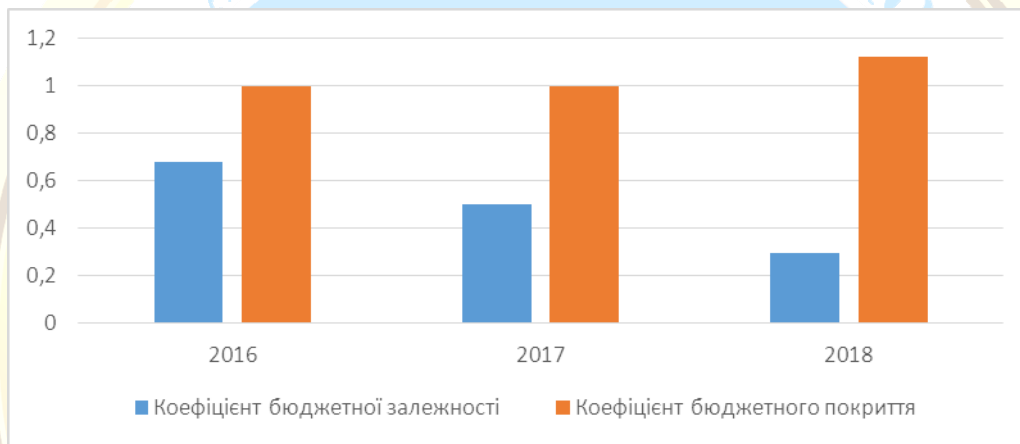
Рис. 2. Показники оцінки бюджетного потенціалу