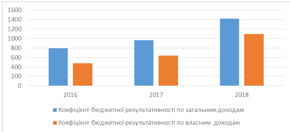
Рис. 1. Бюджетна результативність грн./на людину