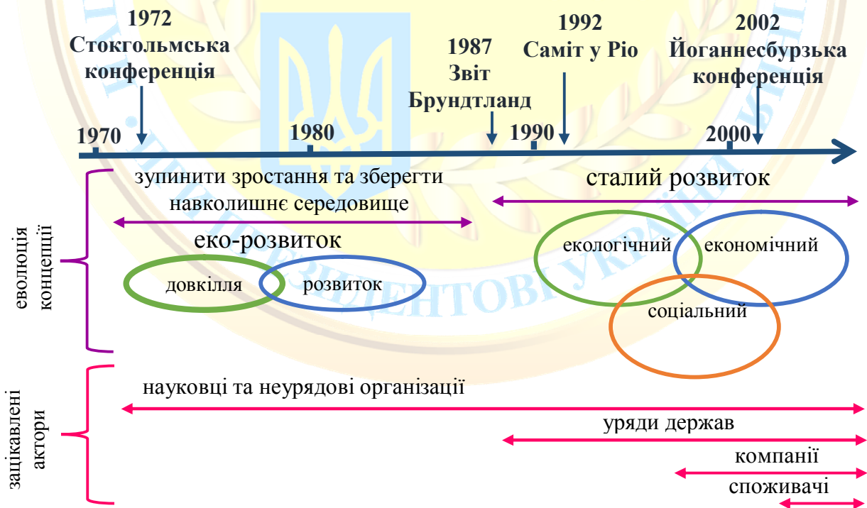
Рис. 2. Схематичний перехід до концепції «сталого розвитку» [25, с. 1]

Багато великих державних та приватних компаній інформують про свій внесок у сталий розвиток. Нарешті, громадська думка все більше усвідомлює проблеми, що виникають при захисті навколишнього середовища та природного капіталу [29, с. 281]. Схематичний перехід до концепції «сталого розвитку» проілюстровано на рис. 2.