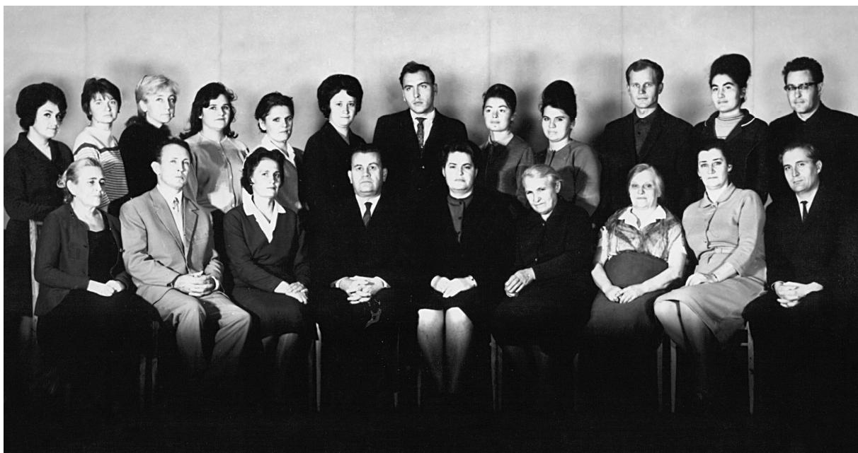
Кафедра в 1960-ті роки.