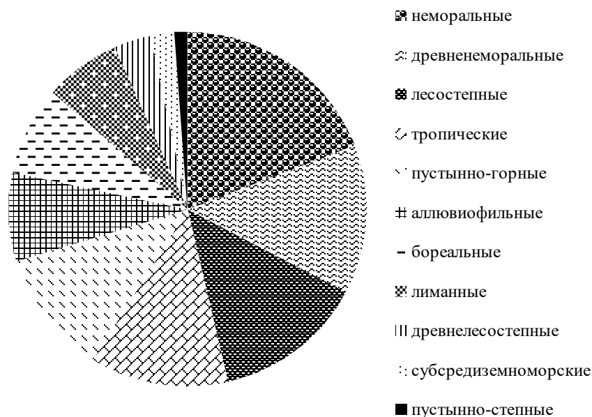
Рис. 2. Ландшафтно-генетические фаунистические комплексы сообществ гнездящихся птиц заказника общегосударственного значения «Лучковский»

В гнездовой период на территории заказника «Лучковский» отмечено 112 видов птиц 16 отрядов. Гнездится здесь на сегодняшний день 88 видов 15 отрядов, которые представлены 11 ландшафтно-генетическими фаунистическими комплексами. Наибольшая доля видов относится к группам типичных неморальных (17), древненеморальных (12) и лесостепных (12) видов. Субдоминируют тропические (11) и пустынно-горные (10) виды.