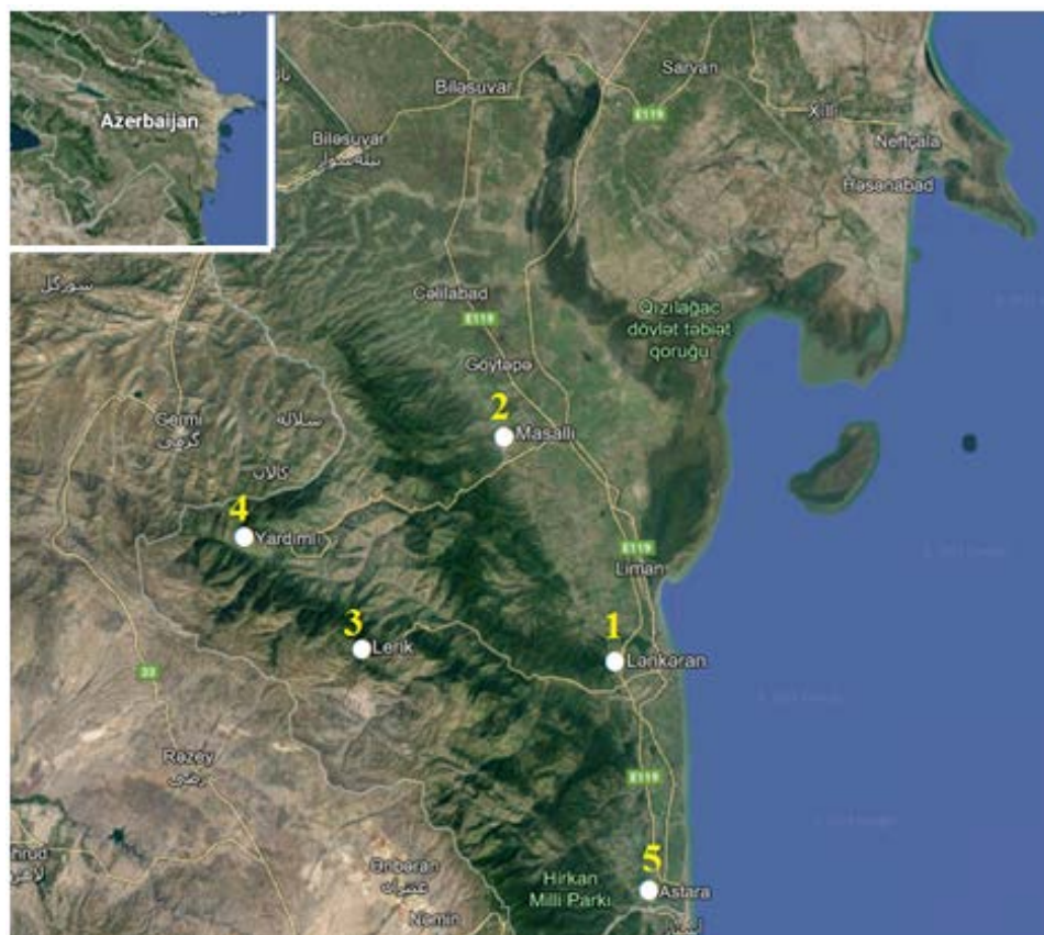
Fig. 1. The sampling points in Talish forests

In total, over 230 soil samples were collected and processed during the research. The collection of soil samples from the surface was carried out by small plastic containers. For studying the distribution of ciliates in deeper layers, 3 cm in diameter and 30 cm long metal tube was driven into the soil. Some of the collected samples were processed in the field, and the main part was delivered to the laboratory and processed according to standard methods (Aleksperov, 2005). To identify the species composition, methods of impregnation of infrastructure by silver nitrate (Chatton, Lwoff, 1930) and protargol (Aleksperov, 1992) were used. Quantitative accounting was carried out using the Bogorov chamber. Taxonomic identification of ciliates was carried out according to the monographs of Foissner (Foissner, 1992) and Aleksperov (Aleksperov, 2005).