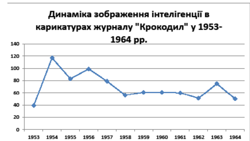
Графік 1. Динаміка зображення інтелігенції в карикатурах журналу «Крокодил» у 1953-1964 рр.

Розподіл кількості карикатур в журналі «Крокодил» у хрущовський період виглядає наступним чином (див. Графік 1.):