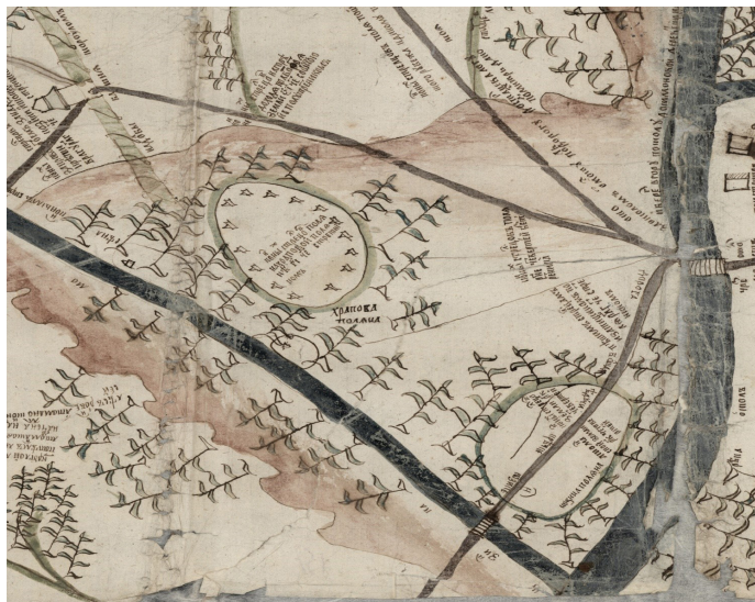
Рис.1. Фрагмент карты Валуйской округи 1687 г. с обозначением Храповой и Козинной поляны.