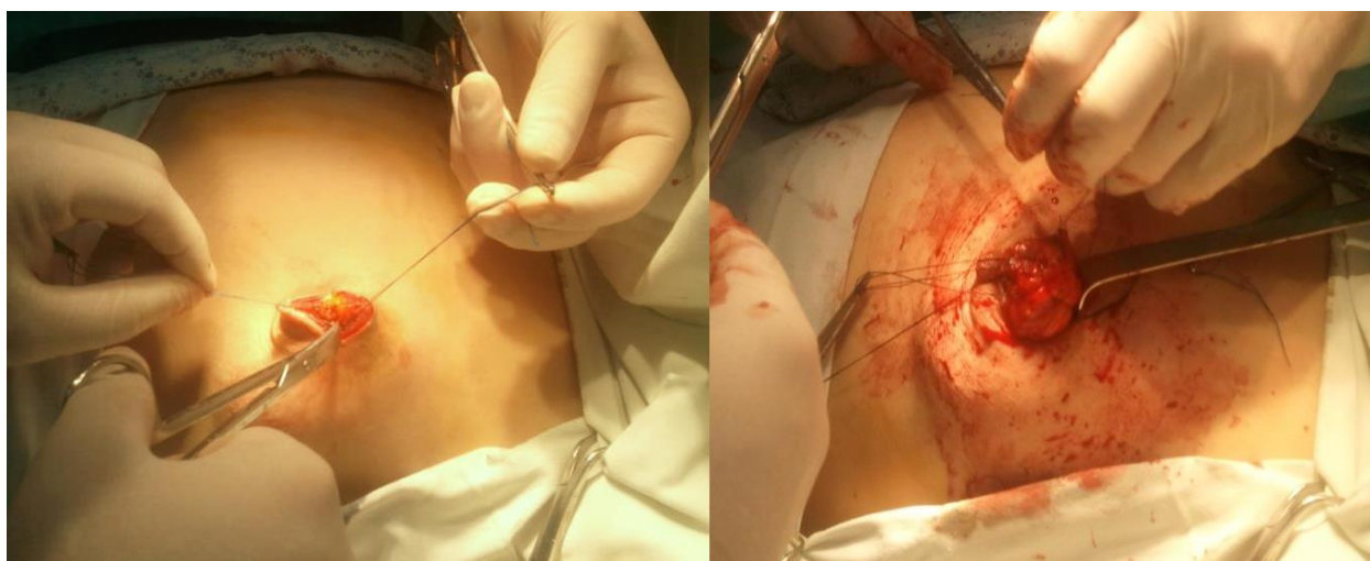
Рис.2. Пациентка С., 32 лет, у которой провели удаление образования молочной железы из периареолярного доступа.

Выполнено хирургическое вмешательство на обеих молочных железах – периареолярный доступ (Рис.2)