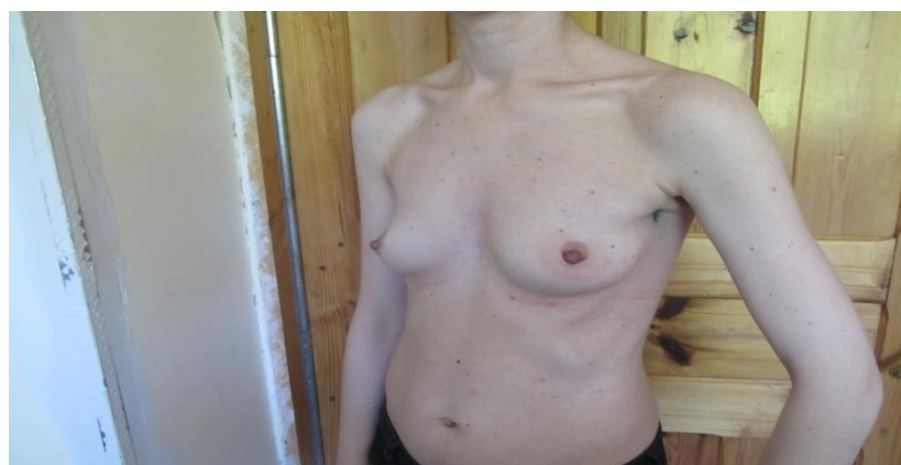
Рис. 7. Пациентка Ф, 38 лет через 1 месяц после оперативного вмешательства.