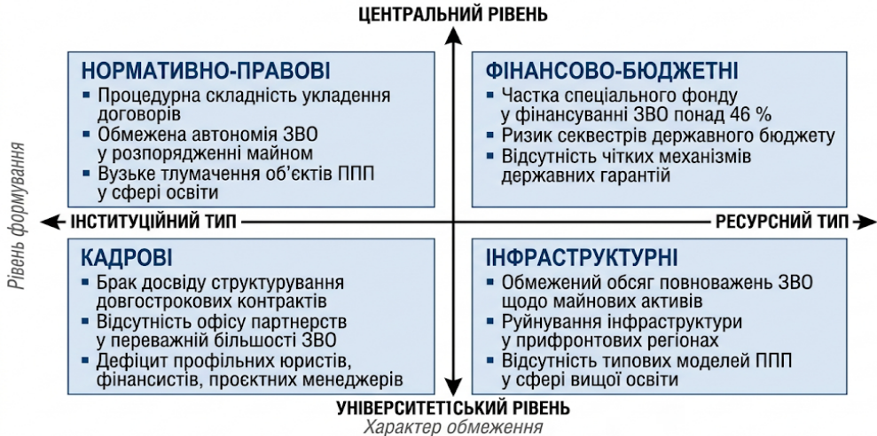
Рисунок 2. Структура чинників, що стримують розвиток публічно-приватного партнерства у вищій освіті України

систів, а й власного офісу партнерств усередині університету – структурного підрозділу, який досі в українських ЗВО є радше винятком, ніж правилом. У Каразинському університеті, який від 1805 р. діє у статусі класичного, сьогодні об'єднано 26 факультетів і навчально-наукових інститутів, – і кожен з них тяжіє до окремої логіки партнерства з окремим типом зовнішнього партнера, що робить централізований шаблон договору заздалегідь непридатним.