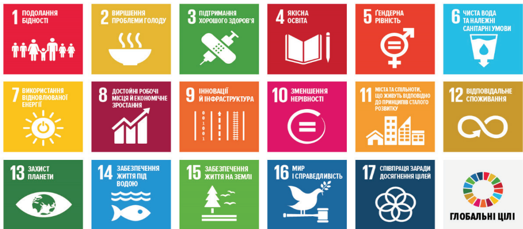
Рис. 1. Загальноприйняті Цілі сталого розвитку ООН

Реалізація цих шляхів вимагатиме від України зосередження зусиль на створенні сприятливого інвестиційного клімату, розвитку інновацій та забезпеченні прав і можливостей для кожного громадянина, що стане фундаментом для сталого розвитку та відновлення країни після війни. А також реалізація зазначених заходів може суттєво сприяти сталому розвитку України, відповідаючи на виклики, визначені в 17 цілях сталого розвитку ООН (рисунок 1). Перш за все, реформування освітньої системи та зосередження уваги на розвитку людського капіталу відіграють ключову роль у досягненні якісної освіти (Ціль 4) та гендерної рівності (Ціль 5), забезпечуючи рівні можливості для всіх. Інвестиції в здоров'я сприятимуть покращенню добробуту населення (Ціль 3).