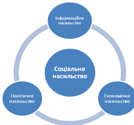
Рис. 1. Трикомпонентне уявлення системи соціального насильства

Інформаційне насильство в широкому сенсі – це не силовий впорядкований вплив на об'єкти, що носить антисоціальний або антисобістисний характер. Інформаційне насильство, маючи природні передумови, виступає особливою формою соціального насильства, де інформаційна складова в результаті інверсії набуває самостійну сутність. Його поширення пов'язане з антропологічною кризою, модернізаційним шоком, розпадом традиційних культур, які звільнили деструктивні та антисоціальні імпульси. У вузькому сенсі інформаційне насильство – несиловий вплив на ментальну сферу [2]. Викладене дозволяє нам відобразити соціальне насильство у вигляді системи, де політичне, економічне та інформаційне насильство становлять “триєдину структуру в орбіті соціального насильства” (рис. 1).