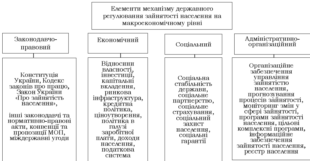
Рис. 1. Класифікація елементів механізму державного регулювання зайнятості населення

динація зусиль навчальних закладів та роботодавців щодо працевлаштування випускників, забезпечення стажування студентської молоді; структурно-інвестиційну політику, спрямовану на створення робочих місць з урахуванням економічних та регіональних особливостей.