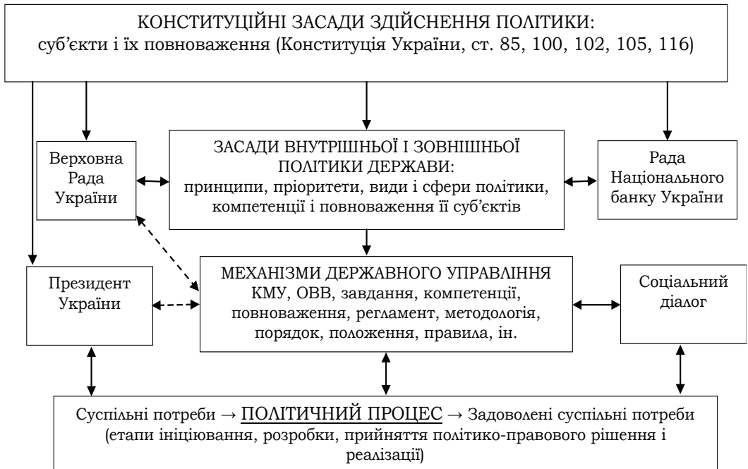
Рис. 2. Основні складові механізму формування Політики в Україні

Механізм формування Політики і відповідний етап політичного процесу (рис. 1, 2; табл. 1) засновані на чинних організаційних, правових, методологічних та інших засадах [20; 27; 29; 22–24].