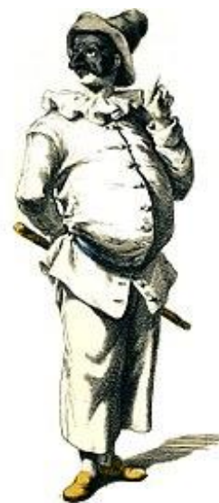
Foto 3. Pulcinella in maschera dalla Commedia dell'arte

La marionetta risulta avere radici così profonde nel paese tanto che anche gli attori drammatici hanno voluto interpretare questo personaggio. Quando, molto tempo dopo, nascerà la famosa Commedia dell'arte, la maschera di Pulcinella ne farà parte e avrà origine nell'antica città di Acerra vicino a Napoli. Sul palcoscenico, poteva interpretare vari ruoli: il servo, il giardiniere, il guardiano, il mercante, l'artista, il soldato, il contrabbandiere, il ladro o il bandito.