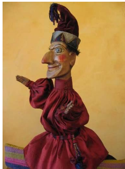
Foto 10. Hanswurst austriaco

Il Kasperle è uno dei preferiti del popolo tedesco e compare ancora nelle strade, nelle piazze, nei bazar e nelle fiere.